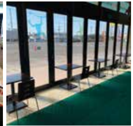
休憩スペースの間引き