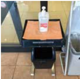
アルコールスプレーまたは 次亜塩素酸水の設置