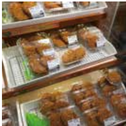
パックや袋に入れて販売